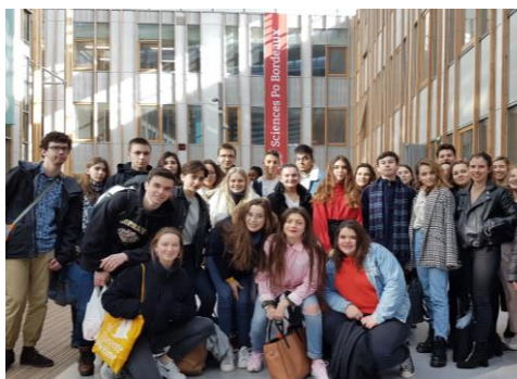
Le 17 janvier 2018 les élèves du module à Sciences Po. Bordeaux

Le lycée Bellevue a intégré, en novembre 2017, le dispositif JE LE PEUX PARCE QUE JE LE VEUX de préparation à l'entrée en première année mis en place par Sciences Po Bordeaux : frais d'inscription réduits, conseils méthodologiques, visite des locaux à Bordeaux.