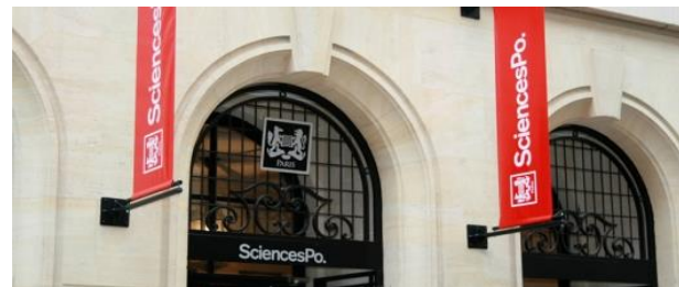
Sciences Po. Paris