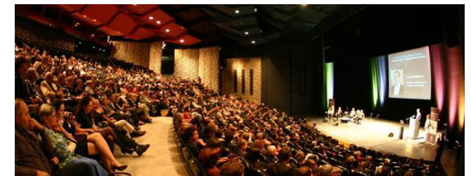
Sciences Po. Toulouse